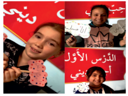
İki Yabancı Dilde Eğitim