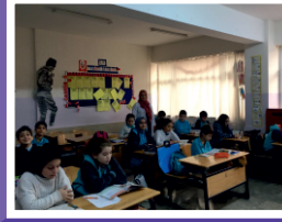
İnternet Bağlantılı Etkileşimli Tahtalar