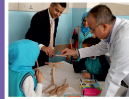
Okuma Köşeleri ve Okuma Saatleri