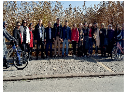
Başarılı Akademik Kadro