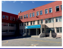
Yeni, Temiz ve Bakımlı Bir Bina