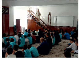
Uygulamalı Din Eğitimi