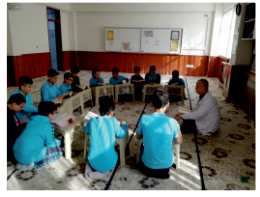
Hem Akademik Hem Din Eğitimi