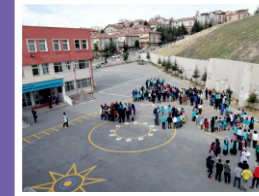
Güvenli Okul Ortamı