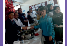
Beslenme Dostu Okul ve Kantin