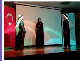
Çok Amaçlı Salonda Yaparak Yaşayarak Öğrenme