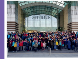
Sosyal, kültürel etkinlikler